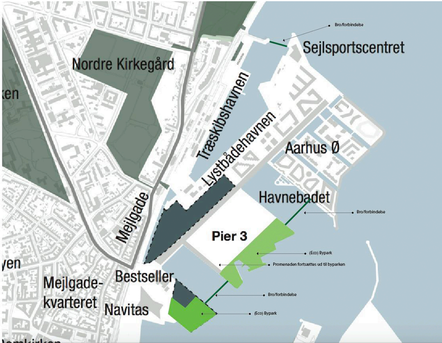
Idéoplæg til Eco Park på Aarhus Ø's Pier 2 og Pier 3 af Mejlgade Lab